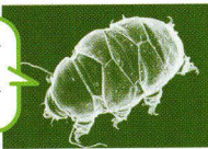
トゲクマムシのなかま